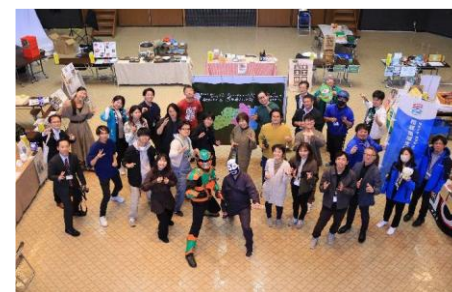
地域の担い手文化彩（伊達市）