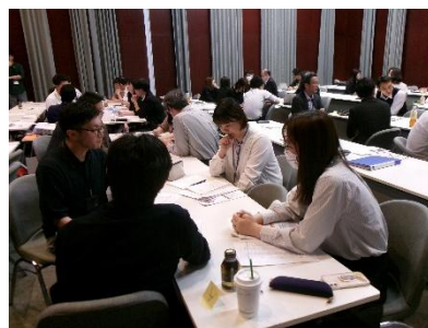
市町村担当者研修の様子