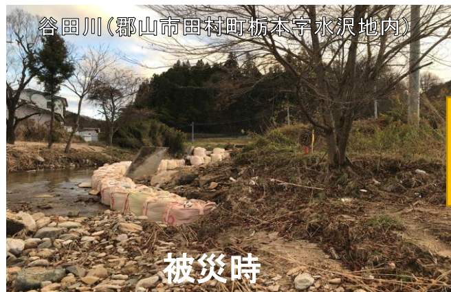
谷田川(郡山市田村町栃本字水沢地内)