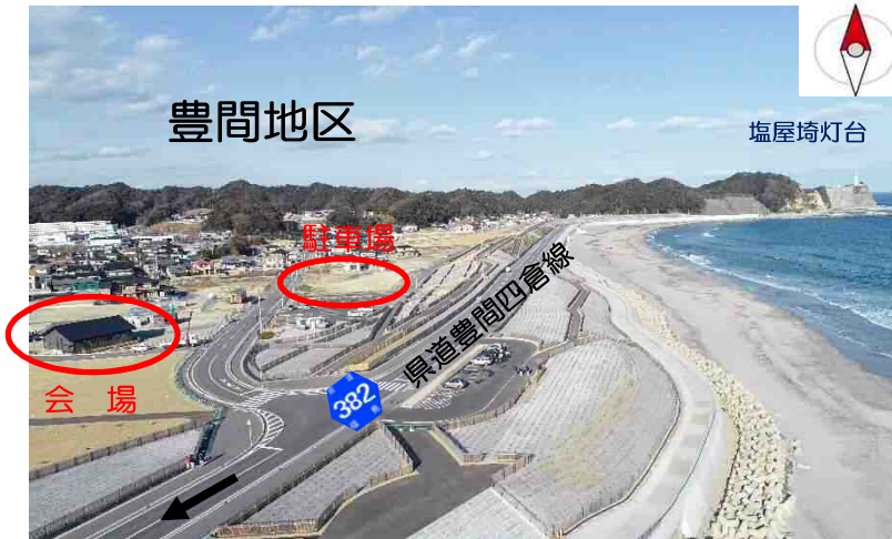
至 主要地方道小名浜四倉線

周辺には、案内看板を設置してあります。 ※駐車場については誘導員の指示に従い駐車願います。