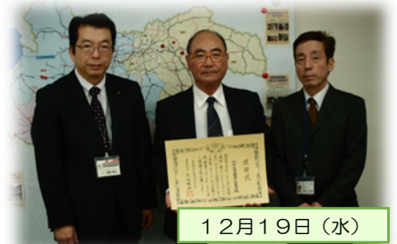
下伊豆島藤田川愛護会