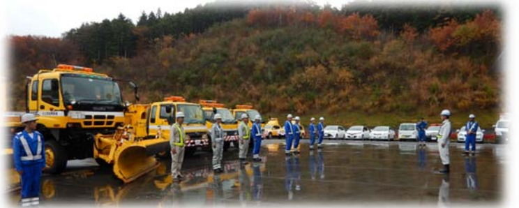
あぶくま高原道路除雪機械出動式

平成30年11月9日（金）に、あぶくま高原道路除雪機械出動式を平田インターチェンジ内の除雪ステーションにて開催し、積雪、凍結シーズンの到来に向けて、安全祈願祭（神事）および安全運転決意表明等を実施しました。