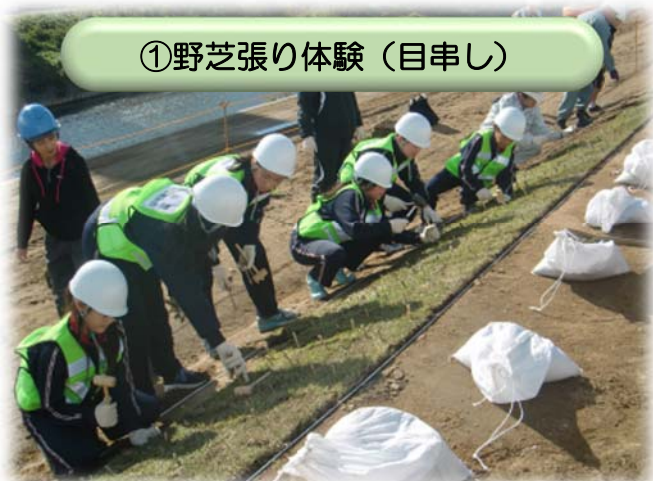
①野芝張り体験 (目申し)