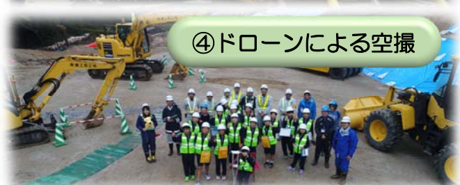
④ドローンによる空撮