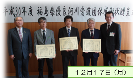
弥六内、上柱田、下柱田行政区