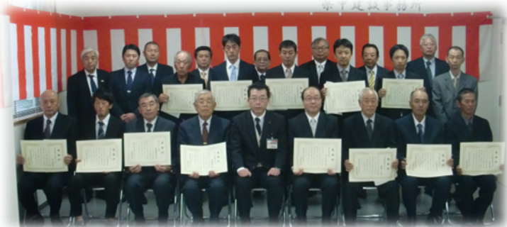
除雪業務感謝状贈呈式（郡山管内）

除雪業務に対する感謝状の贈呈式を各管内毎に開催し、永年にわたり道路除雪に尽力されてきた功労者に対し、感謝状を贈呈しました。