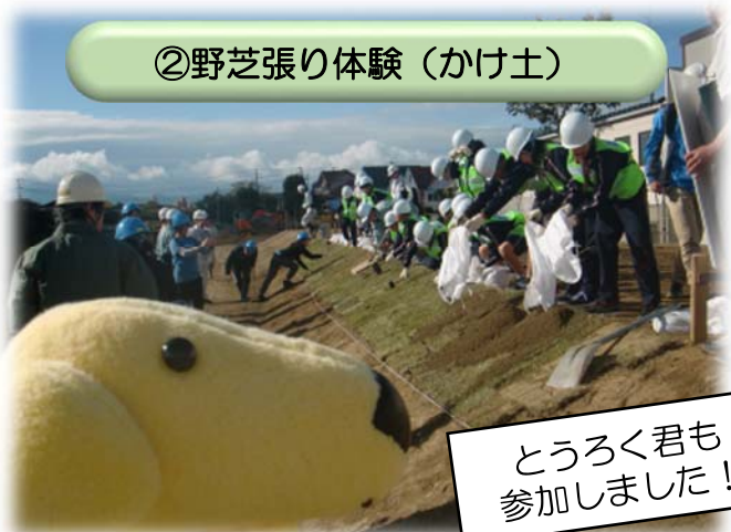
②野芝張り体験 (かけ土)