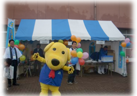
市町村ブースの様子