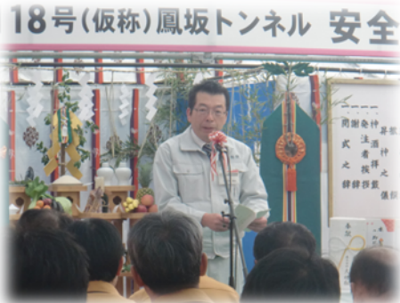
安全祈願祭の様子

国道118号は、福島県の復興計画において、中通りと会津をつなぐ東西連携道路として位置付けられており、県の復興に欠かせない重要な道路です。早期完成に向けて事業を進めてまいります。