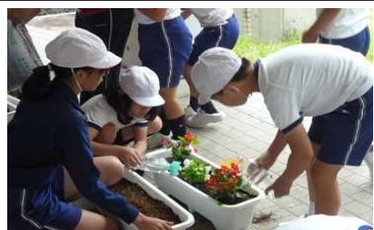
花の苗植え（6/7） 【社川小学校】