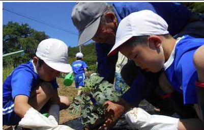
さつまいも苗植え（5/25） 【高野小学校】