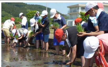
稲作体験：田植え（5/10） 【塙小学校】

今年度も、各学校で地域の皆様のご指導による体験活動を実施しています。「地域の人材活用」「本物の体験活動」「地域の方との交流」などにより、郷土を愛する心を育むとともに、地域人材の智慧に学びながら、人と人、人と地域の絆を大切に作る豊かで優しい心を育成していきます。