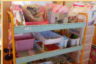
【試行錯誤を保障する材料ワゴン】

できた作品や工夫して遊んでいる姿を認め・褒め、幼児の自信につなげたり、幼児同士が刺激し合ったりできるようにする