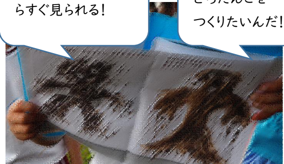
【あの本が近くにあったらいいのになー外でも使える絵本ー】