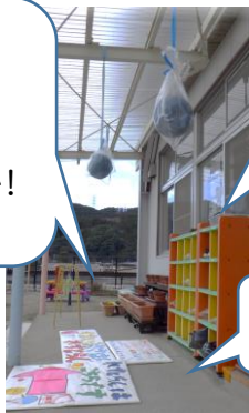
【ベランダに吊り下げたボール-チャレンジの日常化-】