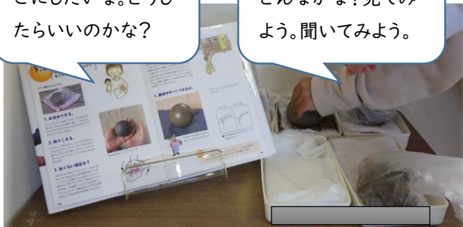
【憧れと似て非なるどろだんごを並べて】