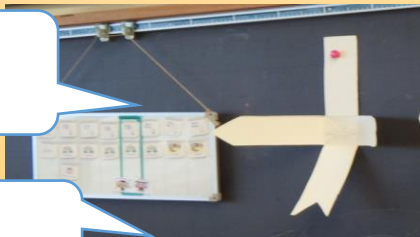
【思いのふくらむ提示】