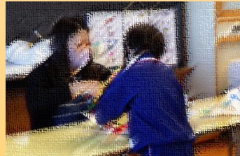
【先生、ここ押さえてね】