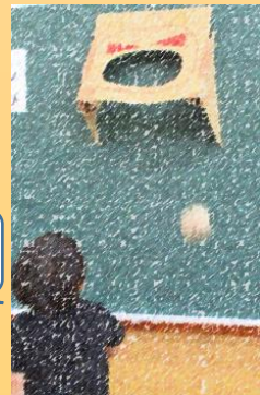
【いつでも試すことができる】

幼児自らが身近な環境に主体的に関わり、試行錯誤したり考えたりすることができるように教師が援助すると・・・ → 比べて考えたり、繰り返し試したりする姿、遊びを発展させたり、新しい遊びを創り出したり「おもしろそう!」「もっとよりよくなりたい!」といった主体的な活動を引き出していました。