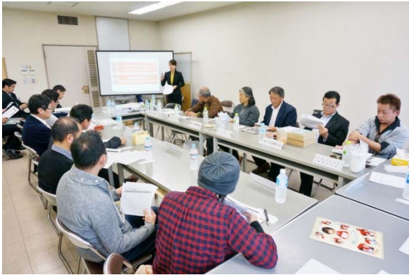
第 1 回クラスター分科会の様子

11 月 12 日(水)15:00 から、福島県いわき合同庁舎 3 階第 2 会議室にて、「平成 26 年度 地域特産品創出事業 第 1 回クラスター分科会」を開催しました。