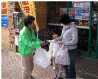
街頭で山火事防止を呼びかけました

3月22日(木)と4月5日(木)の2日間計4方部で、いわき地方山火事防止対策協議会主催による山火事防止パレードが行われました。毎年春先は、山火事が発生しやすいことから、いわき市、市消防本部、磐城森林管理署、市森林組合、県地方振興局、県農林事務所など関係機関が参加して、いわき市内の各地をパレードしながら山火事防止を呼びかけました。山火事は空気が乾燥しやすく入山者が多い時期に多発していますが、その原因のほとんどはタバコの投げ捨てやたき火の不始末など、人の不注意によるものです。