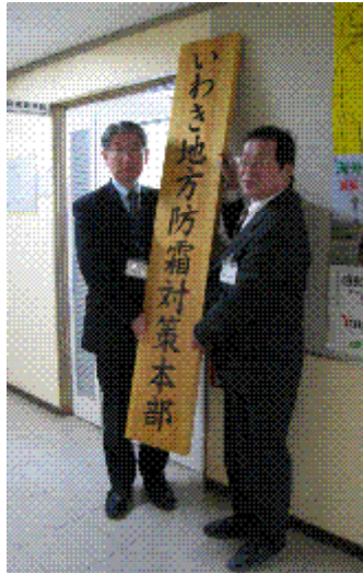
防霜対策会議がスタート

会議終了後、県いわき農林事務所農業普及部に「いわき地方防霜対策本部」の看板が設置され、防霜対策がスタートしました。