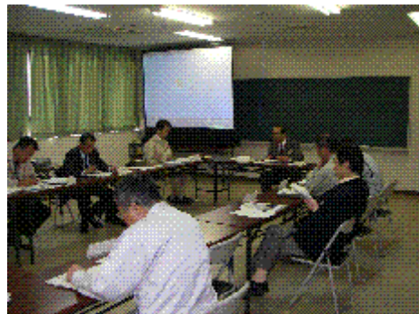
連絡協議会の状況

②いわき市森林組合の防虫防腐加工施設については、従来のACQIによる防腐防虫加工に加え、無色のレザックによる処理機能が追加されました。木材本来の色・風合いがそのまま処理できるため、今後の需要が期待されます。③福島県産「スギ平角材」の強度スパン表については、伐期を迎えた福島県産