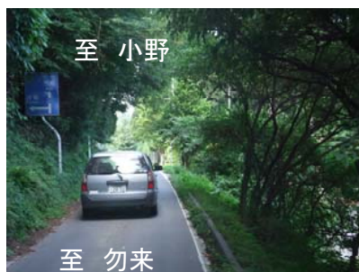
県道いわき上三坂小野線