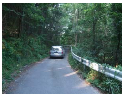
県道三株下市萱小川線