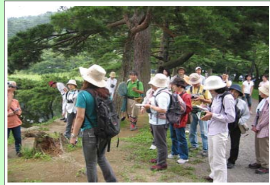
市民とのトンボ観察会