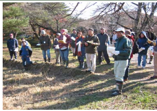
市民との植物観察会