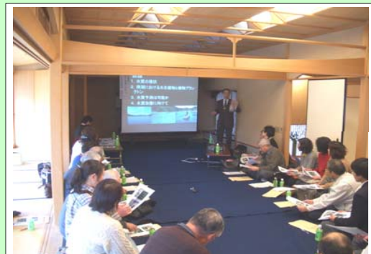
南湖の水質に関する勉強会