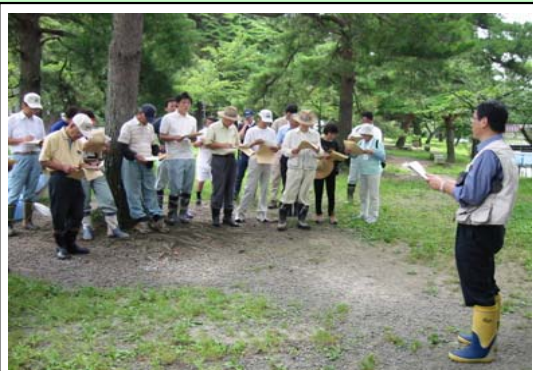
水質調査に参加した市民グループ