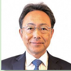
愛知県味噌溜醤油工業協同組合 理事長 イチビキ株式会社 取締役会長