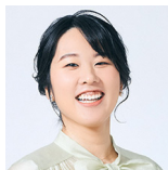
フリーアナウンサー 渡邊 晶子