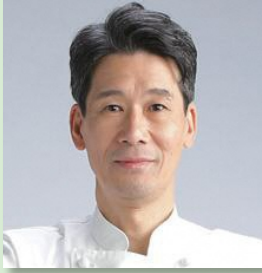
サッカー・ラグビー日本代表 帯同シェフ