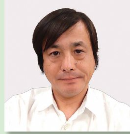
林養魚株式会社 代表取締役

1962年生まれ 愛知県豊橋市出身。イチビキは安永元年創業 祖業の味噌、醤油をはじめ鍋スープ、袋入り惣菜、塩こうじ、あま酒など幅広い製品を展開。自社の味噌蔵から発見した「蔵華乳酸菌」の拡売にも注力している。輸出はグルテンフリー醤油を中心に展開。伝統の醸造技術に加え、時代のニーズに即した最新技術・設備も取り入れ事業を展開している。