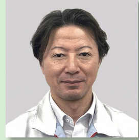
トヨタ自動車株式会社 水素事業推進部 主幹

1974年生まれ 福島県西郷村出身。東日本大震災後、実家のニジマス養魚場から独立し、株式会社林養魚を設立。屋内型養殖プラントを整備し、高品質な「渥美プレミアムラスサーモン」の生産を実現。愛知県内での販売やふるさと納税返礼品として高い評価を得ている。2022年全国・食学会流通関係者賞を受賞のほか、今年4月には、水産業として初めて「ジャパン・レジリエンス・アワード」グランプリを受賞。先進的な養殖技術を通じて地域創生と持続可能な水産業に取り組んでいる。