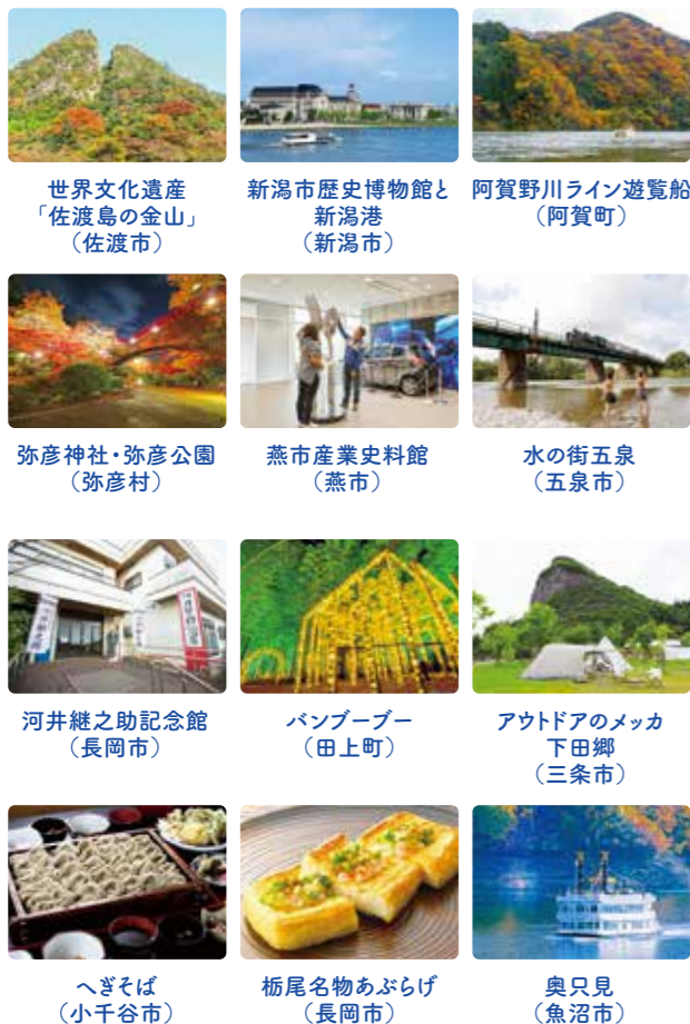
世界文化遺産「佐渡島の金山」(佐渡市) 新潟市歴史博物館と新潟港(新潟市) 阿賀野川ライン遊覧船(阿賀町) 弥彦神社・弥彦公園(弥彦村) 燕市産業史料館(燕市) 水の街五泉(五泉市) 河井継之助記念館(長岡市) バンブーブー(田上町) アウトドアのメッカ 下田郷(三条市) へぎそば(小千谷市) 栃尾名物あぶらげ(長岡市) 奥只見(魚沼市)