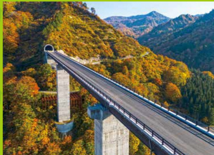
八十里越天空大橋