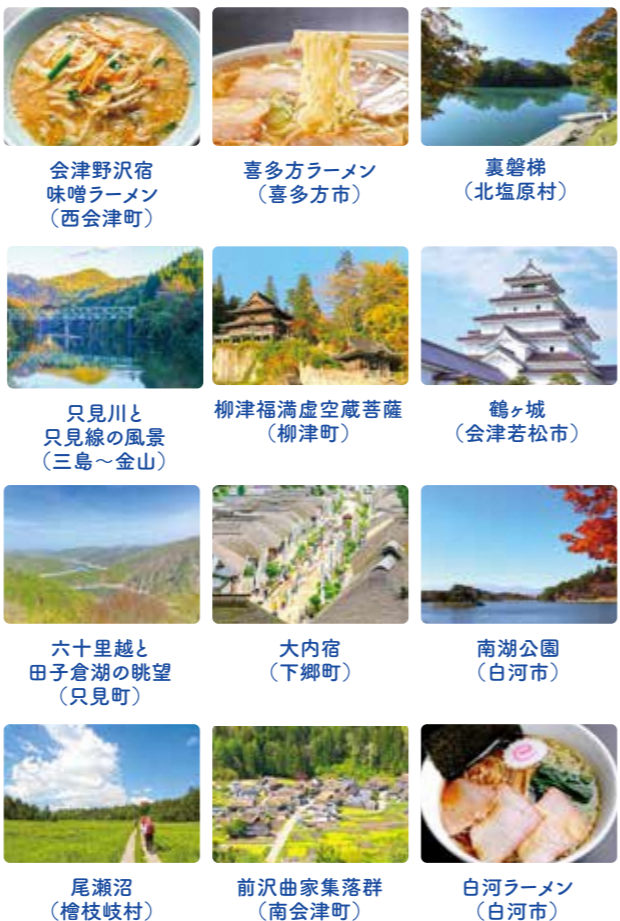
会津野沢宿味噌ラーメン(西会津町) 喜多方ラーメン(喜多方市) 裏磐梯(北塩原村) 只見川と只見線の風景(三島～金山) 柳津福満虚空蔵菩薩(柳津町) 鶴ヶ城(会津若松市) 六十里越と田子倉湖の眺望(只見町) 大内宿(下郷町) 南湖公園(白河市) 尾瀬沼(檜枝岐村) 前沢曲家集落群(南会津町) 白河ラーメン(白河市)