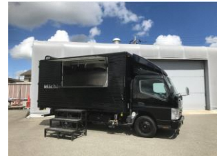
キッチンカーイメージ