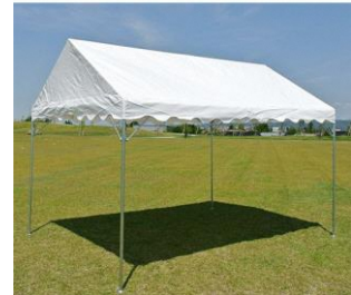
出店テントイメージ (W3,600×D2,700)