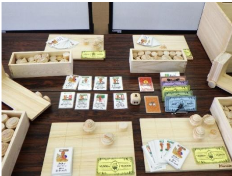
森林経営ボードゲーム