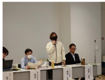
事業者からの取組紹介