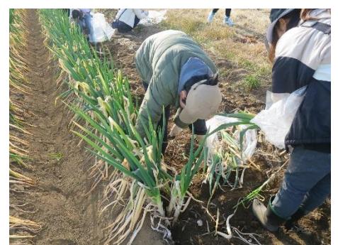
長ネギを収穫する様子