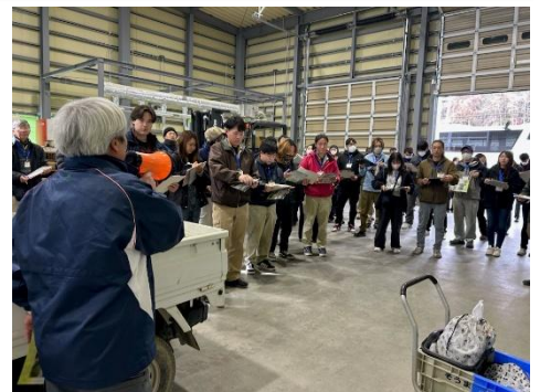
株式会社アグリサービスそうま

今回、相双地方の新規就農者等48名が参加し、南相馬市小高区の農業法人株式会社アグリサービスそうま（小高園芸団地）や、有限会社I Love ファームおだか、株式会社大地のめぐみを