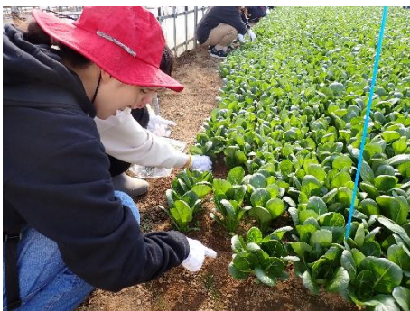
小松菜を収穫する様子