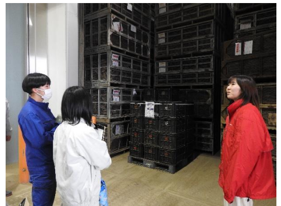
貯蔵施設を見学する見学