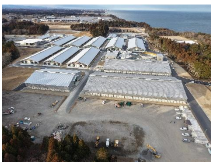
大規模酪農施設(浪江町)