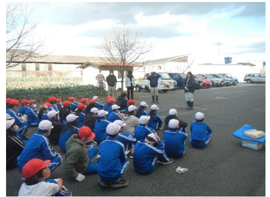
説明を受ける児童の様子