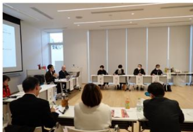
交流セッションの様子

引き続き、相双地方における6次産業化の取組が一層活性化するように、共に考え、共に挑戦し、共に創る「共創」の取り組みを支援してまいります。