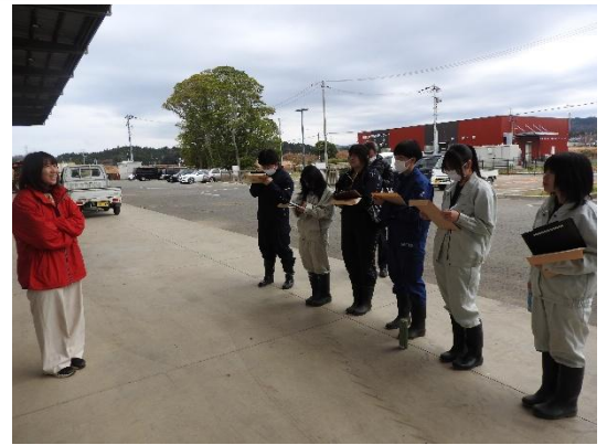
説明を受ける様子