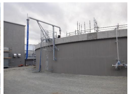
バイオガスプラント