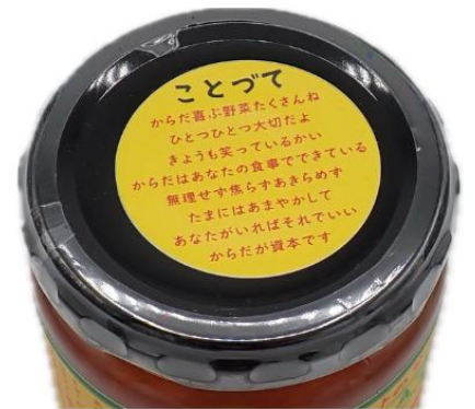
▲蓋に添えられたメッセージ

地元の恵みと、作り手の想いが詰まった一品。ぜひ一度、味わってみてはいかがでしょうか。