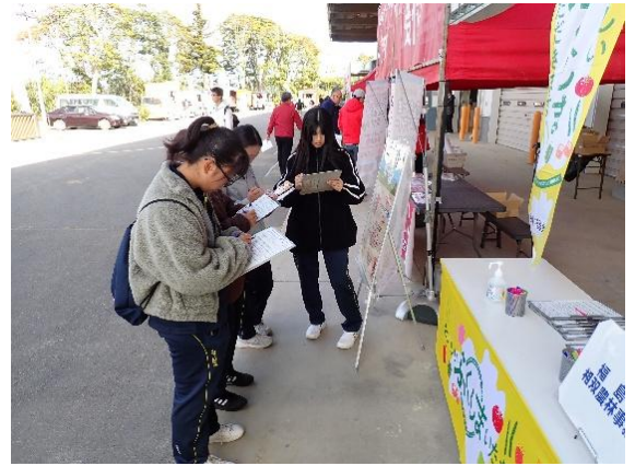
アンケート調査の様子

今後も皆さまからいただいた意見を参考に、地産地消の推進に向けて取り組んでまいります。