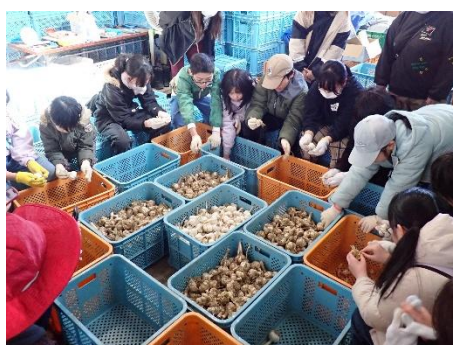
ニンニクの調整作業の様子