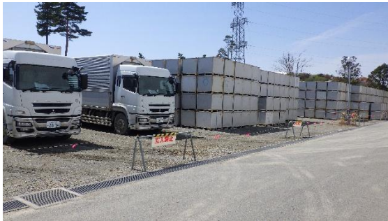
(写真1-2) エリア○の状況 (東側から撮影)