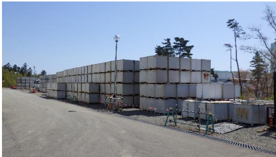
(写真1-1) エリア○の状況 (西側から撮影)