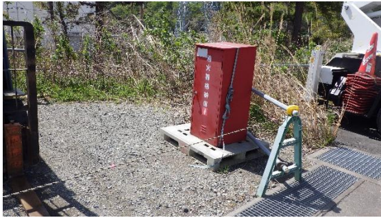
(写真4) エリア西側に備え付けられた消火器