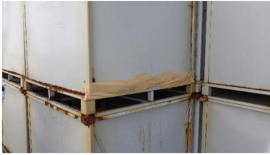
(写真3) テープにより補修されたコンテナ