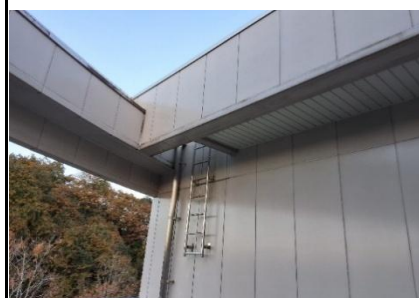
屋上へのアプローチ