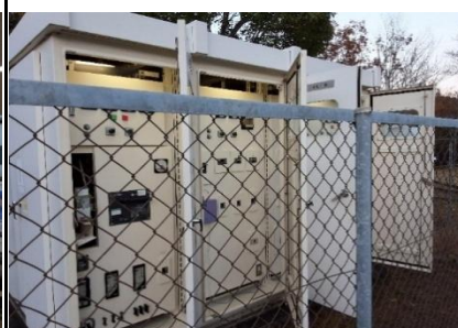
屋外キュービクル