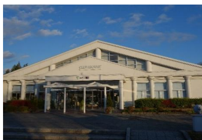
エントランス外観