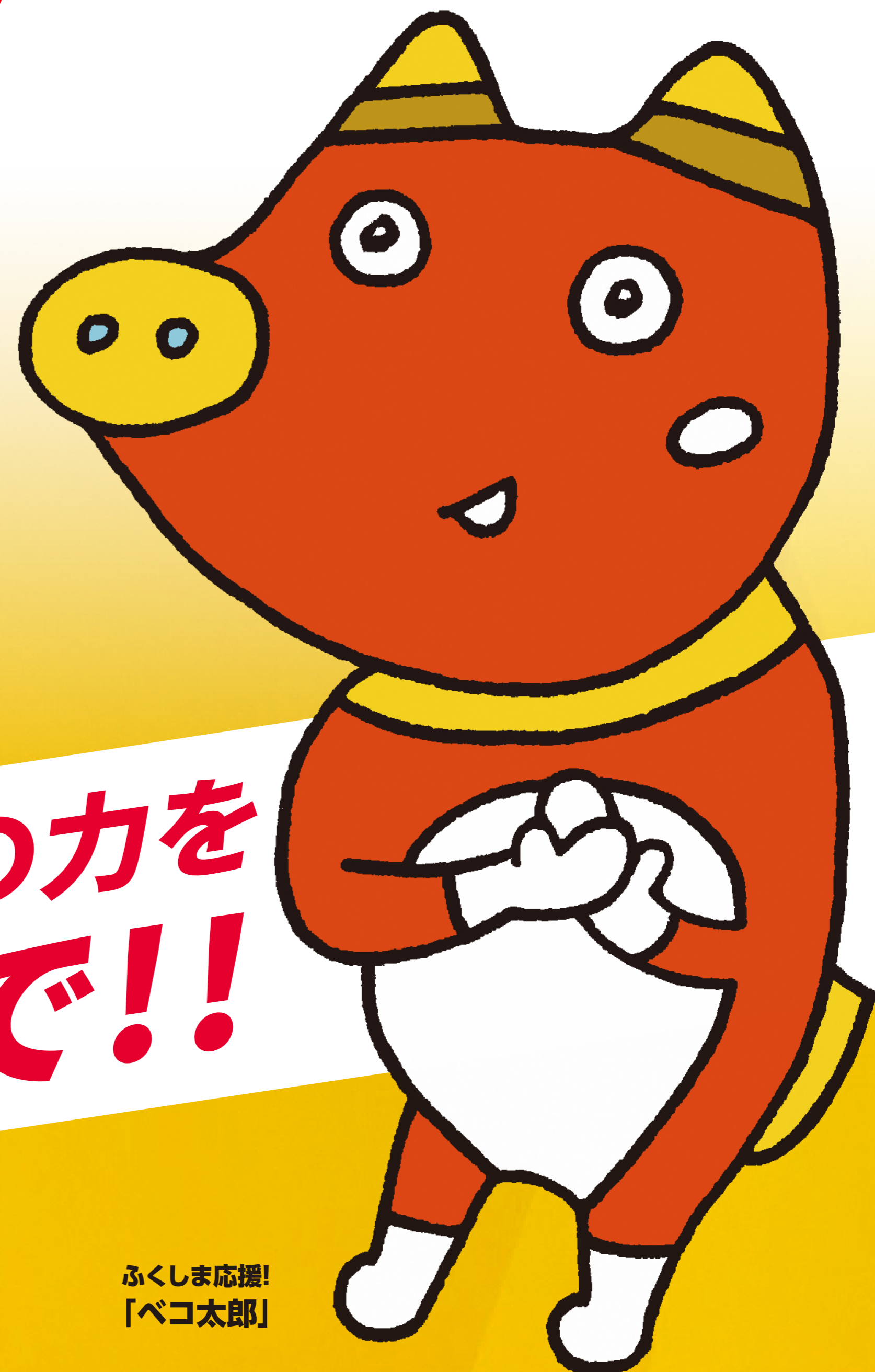
ふくしま応援! 「ペコ太郎」