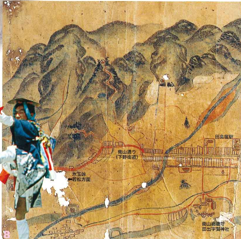
街道すじに神輿の渡御を知らせて廻る御支度触れ。