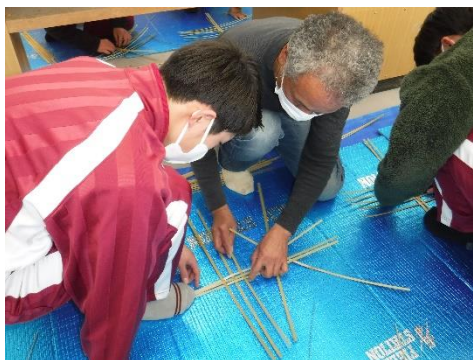
■森林文化出前講座