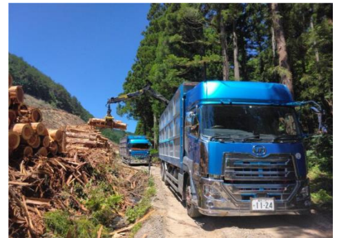
■ 間伐材搬出の支援