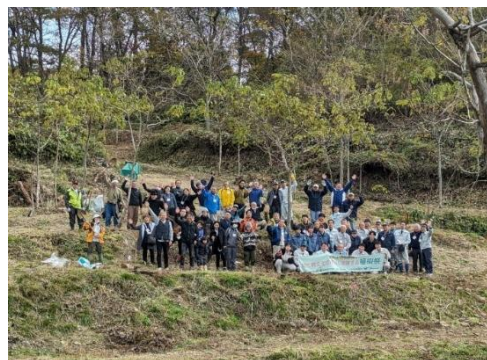
■会津桐玉植苗植樹祭