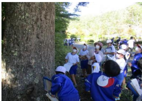
■ 森林環境学習を支援（森林環境基本枠）

実施したほか、集落周辺や街道沿線の森林約 306 ヘクタールを整備しました。また、図書館等の市町村有施設や小中学校、幼稚園等の施設において、県産材を使った木製品の導入 44 件、施設の内装木質化 44 件を実施しました。