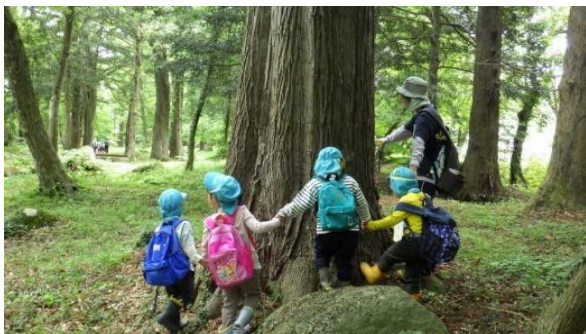
■子ども里山教育支援事業