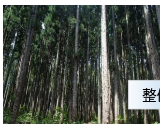
■ 森林整備（間伐）の実施