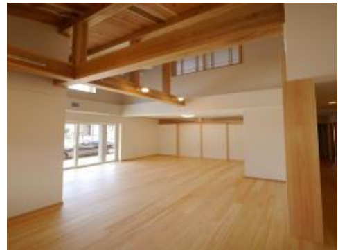
■ ポイント交付住宅