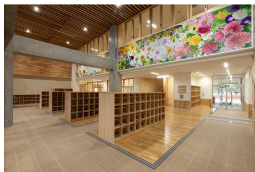
■ 県産材の利活用推進（地域提案重点枠）