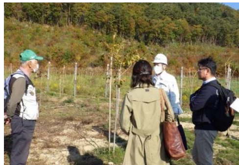
■ もり 森林の未来を考える懇談会