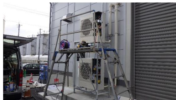
(写真4) 空調設備の設置作業