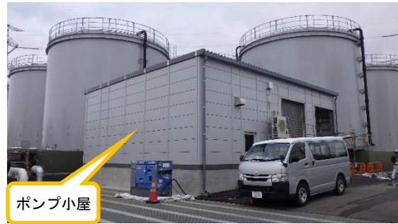
(写真1②) タンク群東側の状況