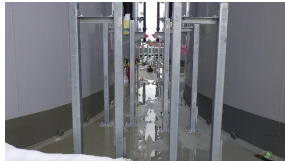
(写真2②) 配管架台の設置状況