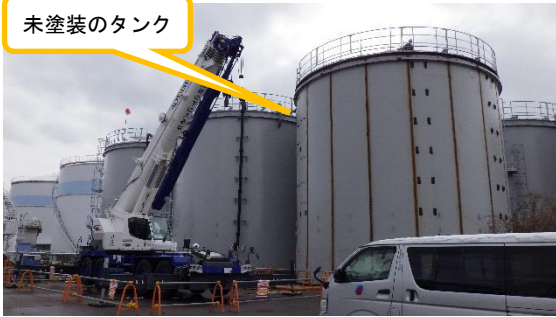
(写真1①) タンク群西側の状況