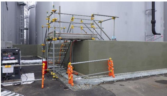
(写真3) 配管の接続作業