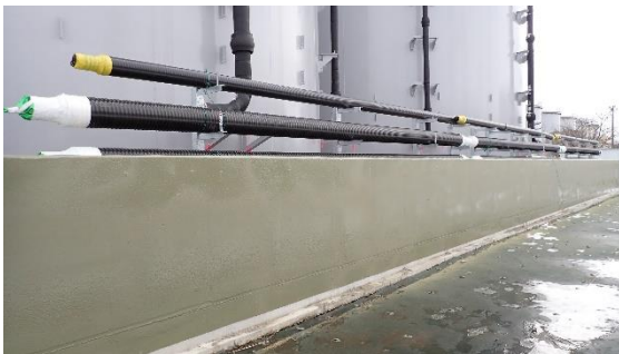
(写真2①) 配管の敷設状況