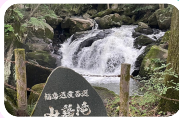
やまとりだし 山鷄滝

山鷄滝は豊かな自然に囲まれた滝。険しい岩肌を一気に流れ落ちる自然の美しさは、「福島遺産100選」に選ばれました。