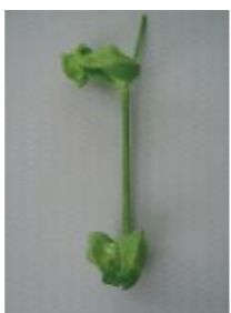
ひどく変形し原型をとどめない =3