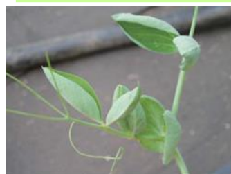
品目: さやえんどう 症状: 葉がカップ状になる