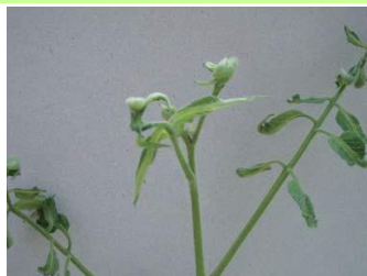
品目: トマト 症状: 葉の異常