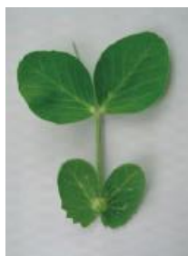
わずかにカップ状 =0.5