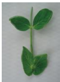
明らかにカップ状 =1