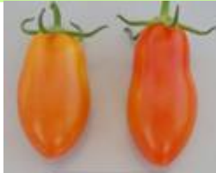
品目: ミニトマト 症状: 果実が細長く変形