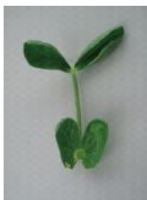
カップ状からさらに変形 =2