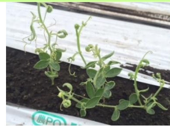
品目: スイートピー 症状: 葉の異常

お問い合わせ先 : 福島県農林水産部環境保全農業課 TEL 024-521-7453 e-mail kankyuhosen_nougyou@pref.fukushima.lg.jp