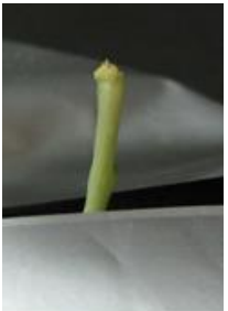
展葉なし（芯止まり） =4