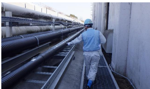
(写真 1-1) ALPS 処理水移送配管の確認状況①