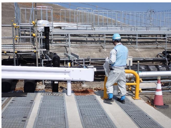
(写真 1-2) ALPS 処理水移送配管の状況②