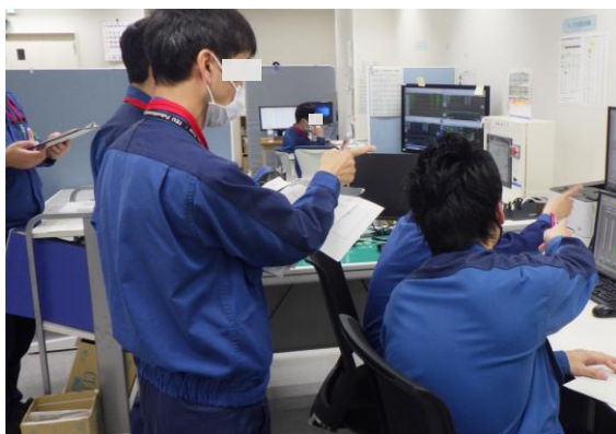
(写真 5) 監視制御装置の操作状況