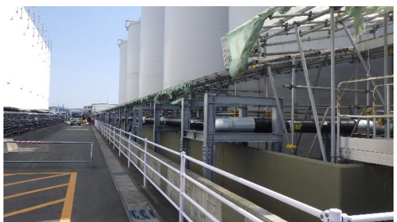
(写真 2-1) K4 タンクエリア周りの状況①