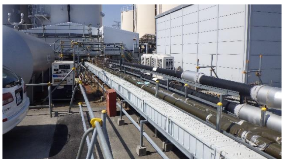
(写真 2-2) K4 タンクエリア周りの状況②