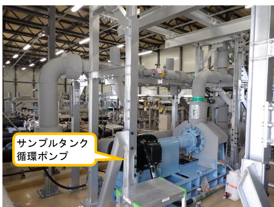
(写真 4) サンプルタンク循環ポンプの状況