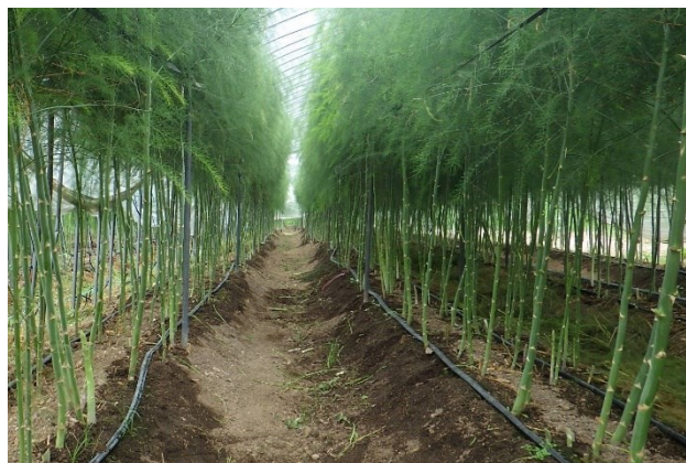
写真6 夏どり開始頃の株の様子