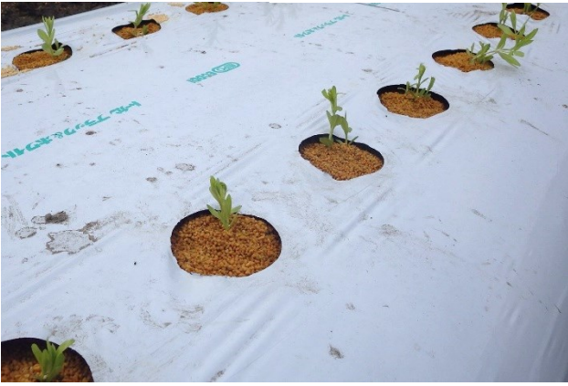
写真1 定植直後のリンドウ苗