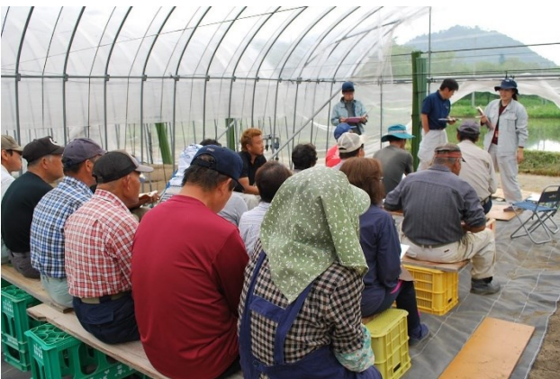
写真5 集団指導会の様子