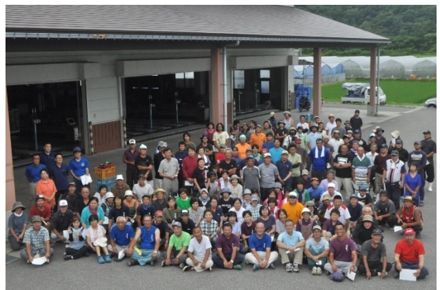
写真6 出荷規格目揃い会での集合写真