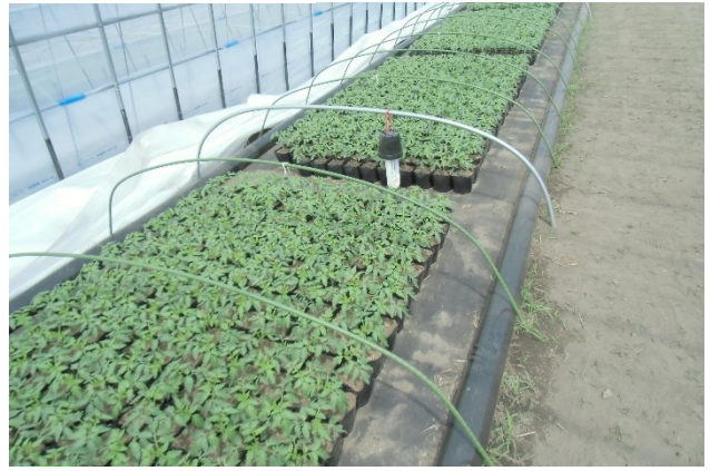
写真2 トマト苗の育苗の様子