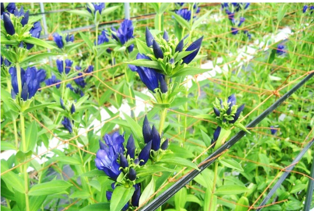
写真5 リンドウ（青紫）