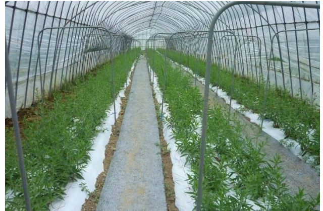
写真4 定植1ヶ月後のカスミソウ