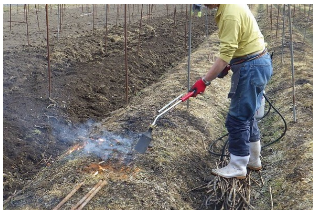
写真3 残茎のバーナー処理