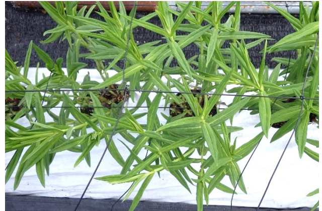
写真4 リンドウの芽整理（整理後）