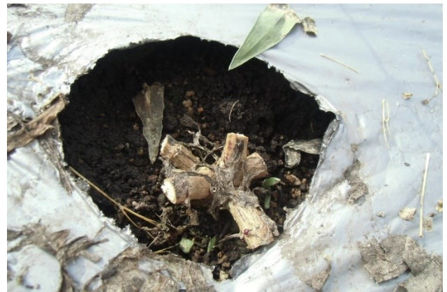
写真6 越冬株の台刈り