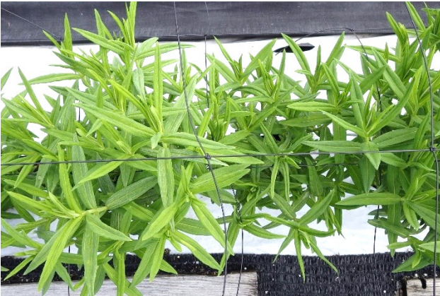
写真3 リンドウの芽整理（整理前）