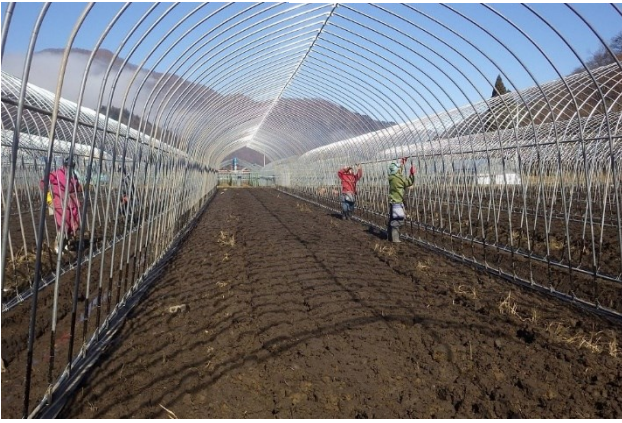
写真1 パイプハウス設営の様子