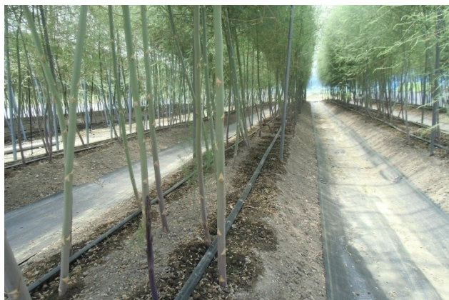
写真5 かん水チューブの設置