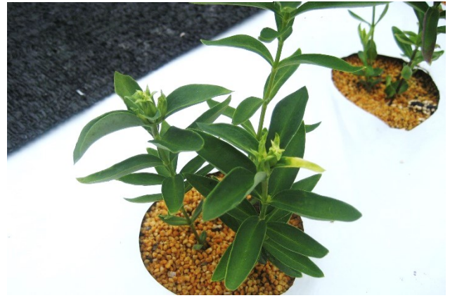
写真2 定植3ヶ月後のリンドウ苗