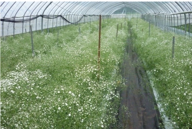
写真5 収穫時のカスミソウ