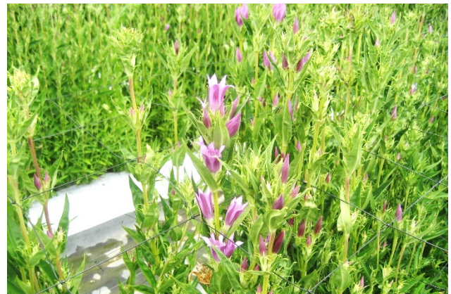
写真6 リンドウ（ピンク）