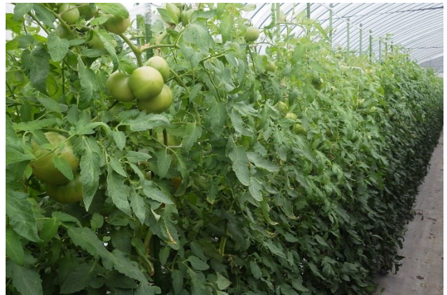
写真4 収穫期のトマトほ場の様子