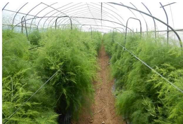
写真2 定植した年の株養成の様子