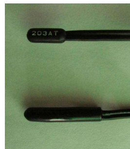
図1 樹脂製の汎用センサー