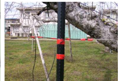
図2 温度センサーの設置方法