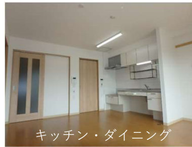
キッチン・ダイニング