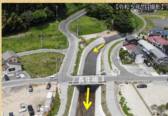
車川護岸 工事状況