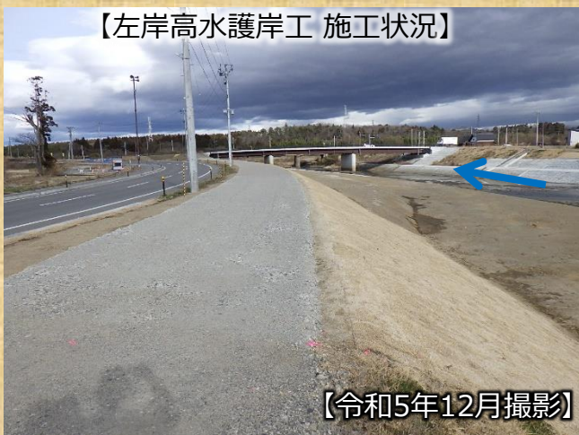
【左岸高水護岸工 施工状況】

令和6年度は、引き続き滑川橋上流側において、右岸の護岸工、左岸の高水護岸工(築堤工)の工事を実施します。