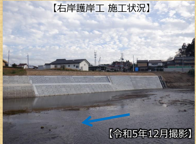
【右岸護岸工 施工状況】