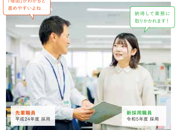
先輩職員 平成24年度 採用