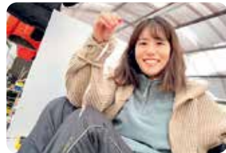
冬の休日はワカサギ釣りへ！