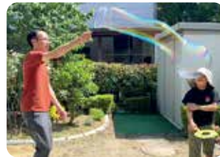
実家にもたびたび帰省

デジタル変革課で簡易申請システムの運用や無線LANシステムの実証事業等を担当しています。子どものクラスが学級閉鎖となった際には在宅勤務を活用し、自宅から職場のパソコンにリモート接続することで業務を継続できました。他にも、早出遅出勤務も活用し、子どもが保育園の時期は勤務開始時間を早め、小学校に上がってからは勤務開始時間を遅らせてました。制度もシステムも充実してきており、多様な働き方ができる職場へと変化しています。休日は子どもの習い事や公園、商業施設へ行くなど、家族と一緒に過ごせる時間を大切にしています。