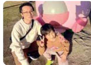
休日は子どもと公園

時代の変化に柔軟に対応しながら、 働きがいのある・働きやすい環境づくりをすすめています。