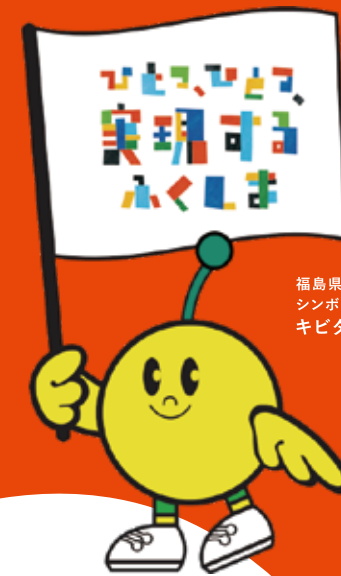
福島県復興シンボルキャラクターキビタン