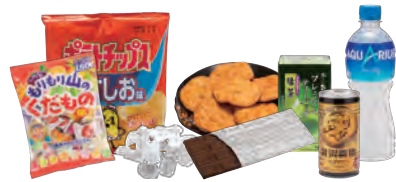
各種菓子・嗜好品