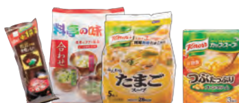
インスタントみそ汁、即席スープ等