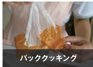
バッククッキング

断水時には、まな板もきちんと洗えない状態となりますので、まな板を使わず、キッチンペーパーを使って空中で食べ物をカットし調理する方法です。