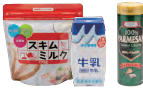
ロングライフ牛乳・粉チーズ・スキムミルク