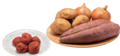
梅干し・漬物・日持ちする野菜類

野菜の煮物やサラダ、汁物など。主食、主菜で不足しがちなビタミン・ミネラル・食物繊維の供給源