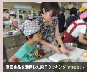
備蓄食品を活用した親子クッキング(東海農政局)