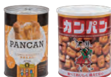
缶詰パン・乾パン