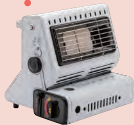
カセットボンベで使用できるガストーブ ▲