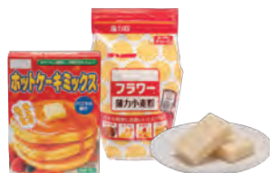
小麦粉・米粉・餅