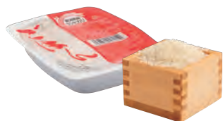
精米・無洗米・パックご飯等