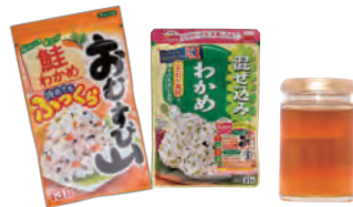
ふりかけ・ジャム・はちみつ等