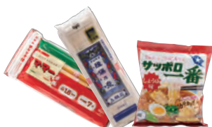
乾麺・即席麺・カップ麺