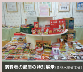
消費者の部屋の特別展示(農林水産省本省)

農林水産省では、食料安全保障の観点から、家庭備蓄の普及に向けて、省内外での展示や防災イベントへの参画、各種ガイド、リーフレット、動画の作成・普及、政府広報の活用等を積極的に行っています。