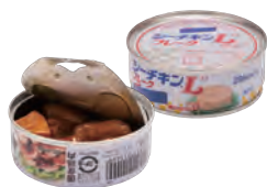
肉・魚・豆などの缶詰