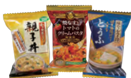
フリーズドライソース類