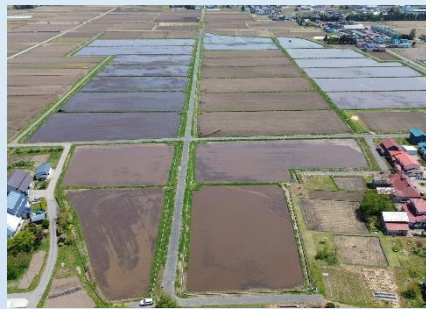
地区上空 西から東を撮影

本地区では高収益作物として、きゅうり・かすみ草・トマトを導入するため、客土や湧水処理を行い、水田転換畑を準備しました。 きゅうりは5月播種、7月収穫予定で、かすみ草は6月苗植え、8月に収穫予定です。 トマトはR7年度から播種予定で、将来は、きゅうり：0.2ha、かすみ草：0.3ha、 トマト：0.7haの作付面積を目指しております。