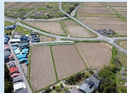
地区西側上空 北から南を撮影