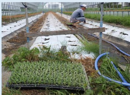
かすみ草苗植え状況

本地区では高収益作物として、きゅうり・かすみ草・トマトを導入するため、客土や湧水処理を行い、水田転換畑を準備しました。 きゅうりは5月播種、7月収穫予定で、かすみ草は6月苗植え、8月に収穫予定です。 トマトはR7年度から播種予定で、将来は、きゅうり：0.2ha、かすみ草：0.3ha、 トマト：0.7haの作付面積を目指しております。