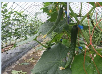
きゅうり生育状況