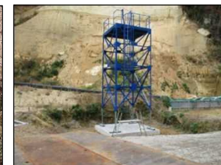
【復旧工事中】 （橋脚が完成）

速やかな営農再開のため、復旧に専門的な知見が必要な場合は、農林事務所へご相談ください。