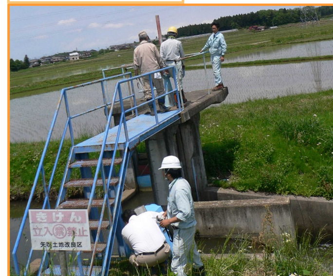
施設の点検・診断