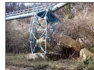
【復旧前】 （管路・橋脚が破損）

（新地町 鴻ノ巣第1地区 幹線用水路【施工中】） 県営で造成された幹線用水路の水管橋が、地震に伴う転石崩落により被災。復旧に高度な技術を要するため、県営災害復旧事業により復旧工事を実施中（R5.12月で橋脚が復旧完了。R6.3月完成予定）。