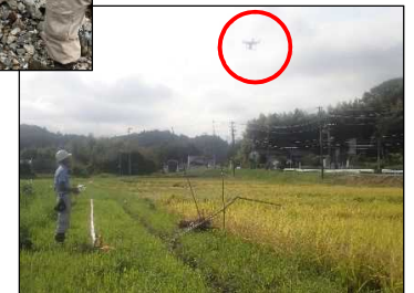
右：ドローンを 活用した 広域的な 被害状況調査

農地や施設の復旧を速や かに行い、農家が安心して 営農に取り組めるようにしま しょう。