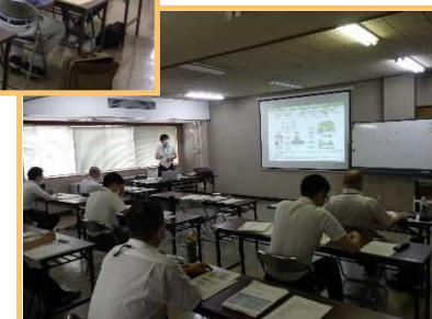
森林経営管理制度研修