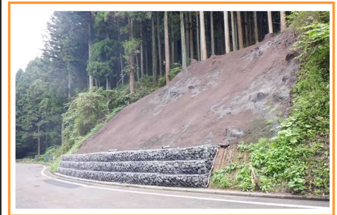
被災した林道法面の復旧

※林道施設災害復旧事業の申請者・事業主体は各市町村長です。 当該支援は、県が代行するものではありませんのでご注意ください。