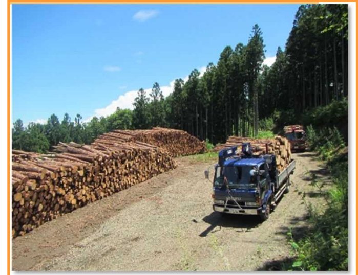
林道を利用した間伐材搬出