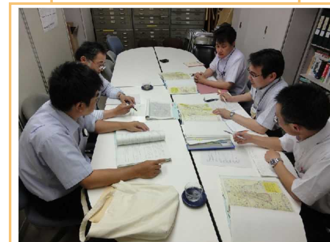
市町村ごとの支援

●放射性物質の影響を調査しながら、原木林の伐採と更新を図る施業を進めて、次世代のきのこ原木林等を再生しましょう！