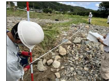
左：田への土砂 流入地区 被災調査