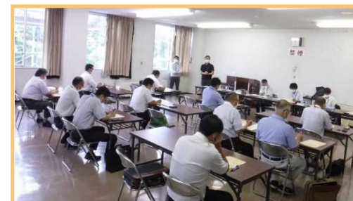
市町村担当者会議