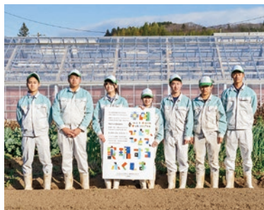
修明高等学校の皆さん