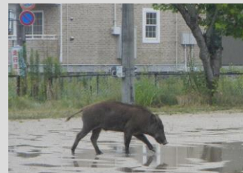
市街地に出没したイノシシ

本来、イノシシは用心深い性格ですが、不意に人と遭遇してしまうと、興奮して攻撃性が高まる場合があります。イノシシに出会ってしまったら、落ち着いて、下記の対応を心がけてください。