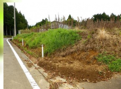
イノシシによる掘り返し