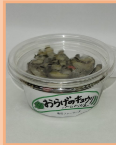
亀石ファーマーズ