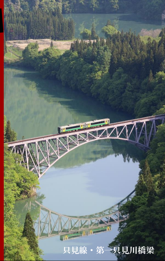
只見線・第一只見川橋梁