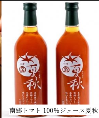
南郷トマト 100%ジュース夏秋