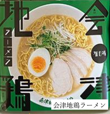
会津地鶏ラーメン