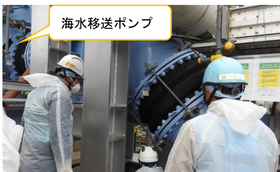
(写真 3 - 8) 海水移送配管