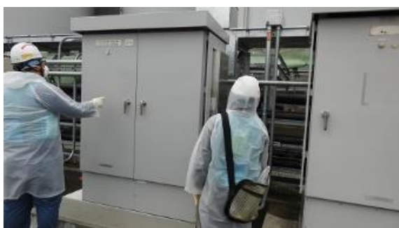
(写真3-1) ALPS処理水サンプルタンクの現場盤