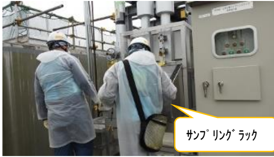
(写真 3 - 9) 希釈後ALPS処理水サンプリング ラック