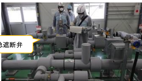
(写真 3 - 6) 緊急遮断弁 (上流側)