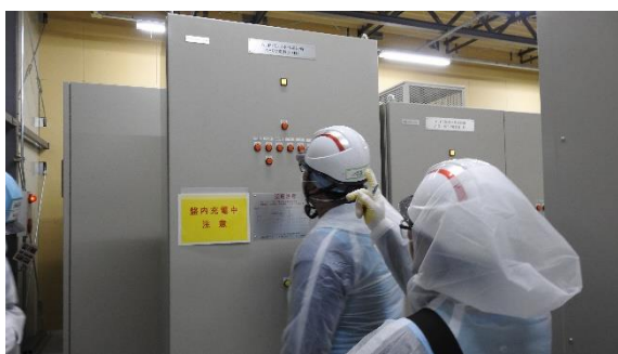
(写真 3 - 5) ALPS 処理水移送設備に係る電源盤等