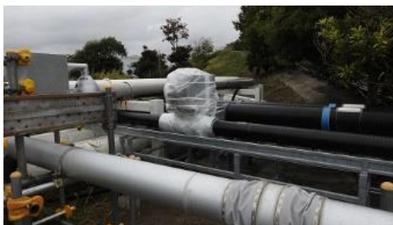
(写真1) 漏えい検知器が発報したベント弁