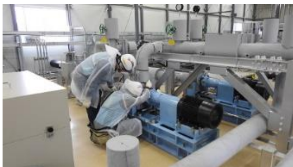
(写真 3 - 4) ALPS 処理水移送ポンプ