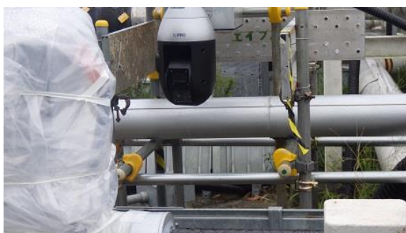
(写真2) ベント弁を監視するためのカメラ