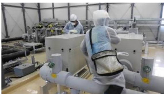
(写真3-3) ALPS処理水移送ポンプ出口放射線モニタ