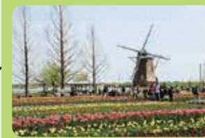
チューリップフェスティバル(4月) (柏市)