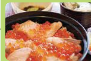
巨理町荒浜・発祥「はらこめし」 (巨理町)