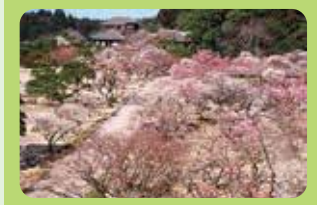
水戸の梅まつり (2月) (水戸市)