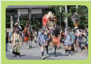
相馬野馬追 宇多郷行列 (相馬市)