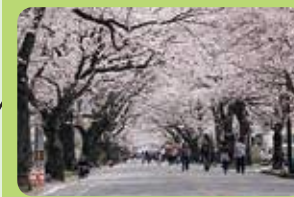
夜の森の桜 (4月) (富岡町)