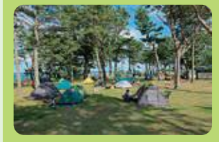
天神岬スポーツ公園 (楢葉町)