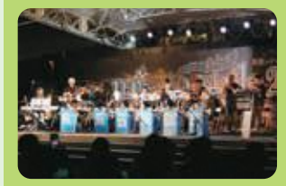
～ジャズとグルメの祭典～ misato style (10月) (三郷市)