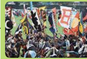
相馬野馬追 神旗争奪戦 (南相馬市)