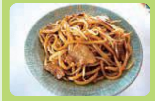
なみえ焼そば (浪江町)