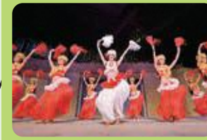
スパリゾートハワイアンズ (いわき市)