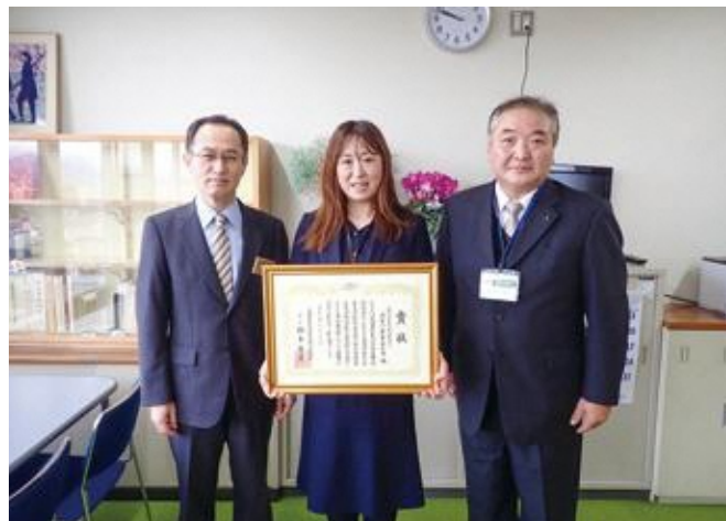
小柴前農林水産部長に報告