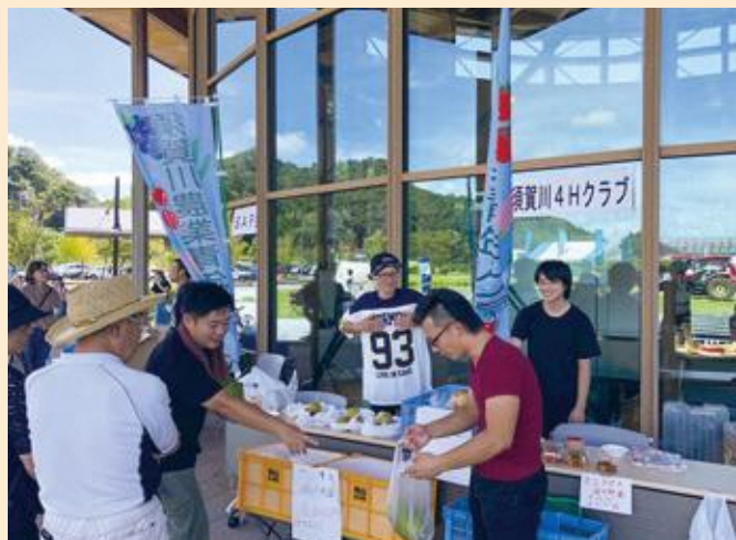
H30 農業総合センターまつりでの直売