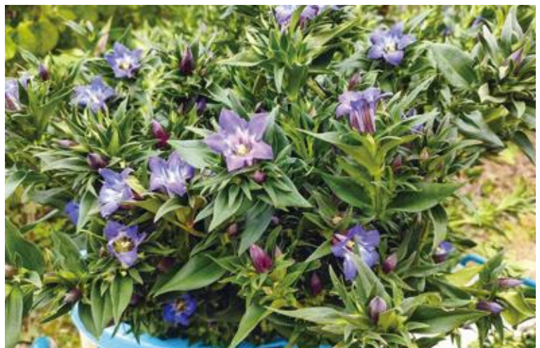
りんどう新品種「天の川」