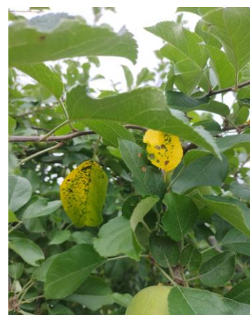
図1 リンゴ褐斑病発病葉 （令和5年7月13日撮影）