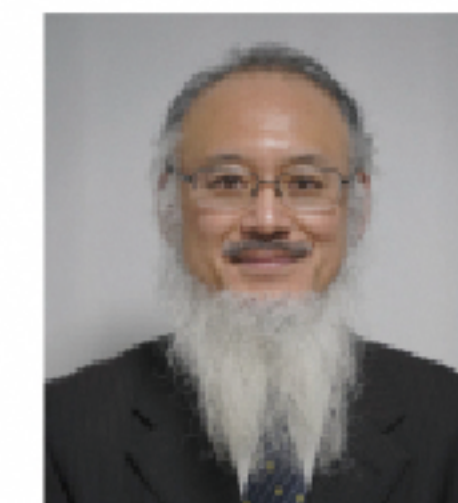
国立天文台上席教授 渡部潤一氏

※詳細は近日ホームページにてお知らせします。(https://www.fcp.or.jp/history/)