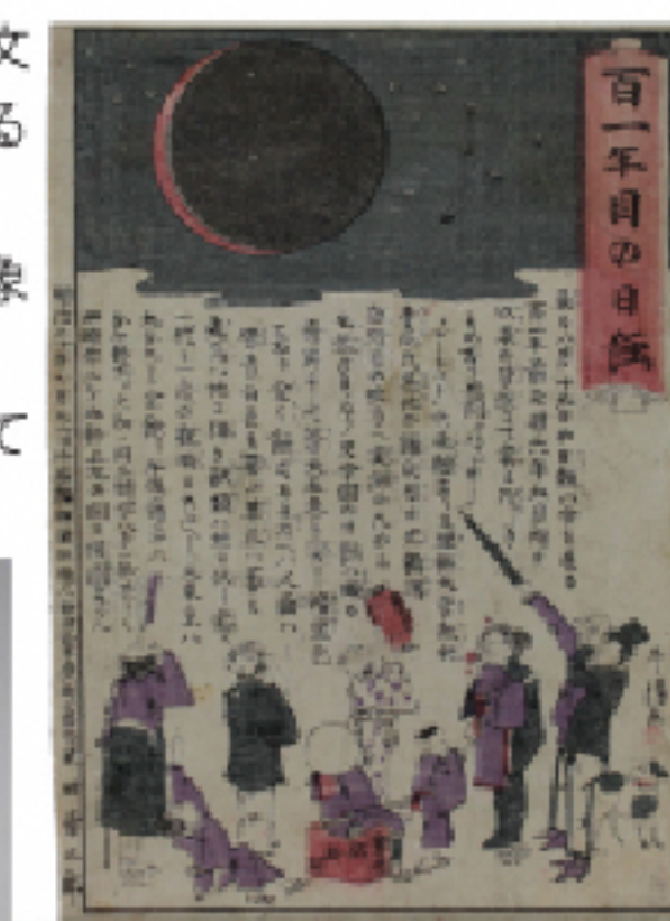
明治20年(1887)の皆既日食を 報じた錦絵(個人蔵)