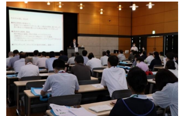
多くの事業者が参加した交流会の様子