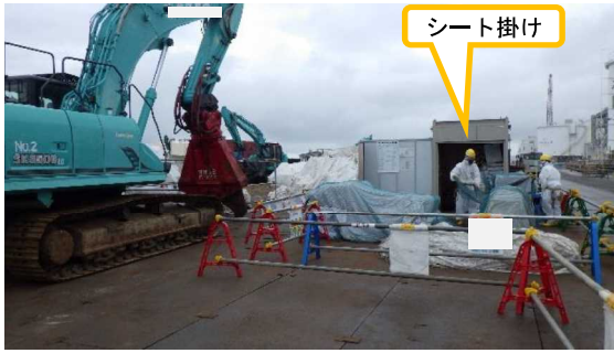
(写真5) 小割解体ヤードでの作業状況