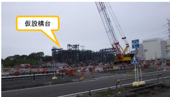
(写真1) 西門前ヤードの状況