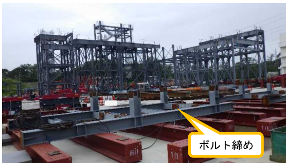
(写真2) 組立作業の状況