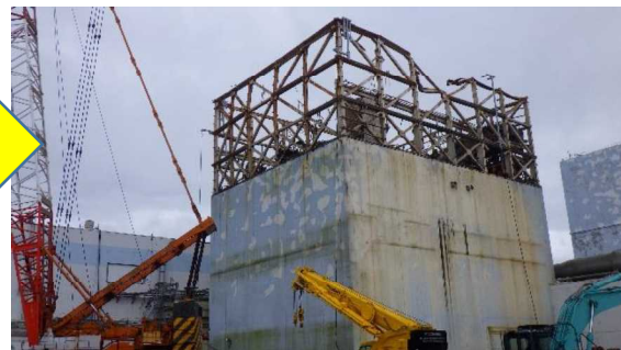
(写真4-2) 同左 (令和3年7月1日撮影)