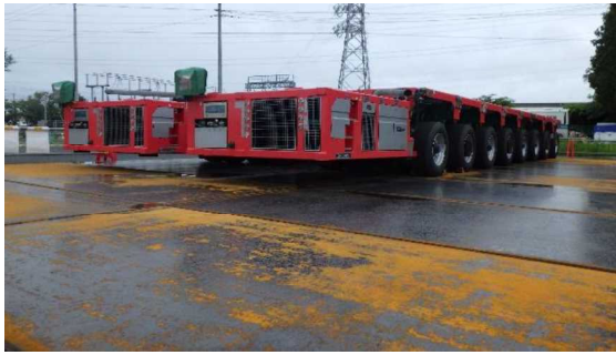
(写真3) 重量物運搬車