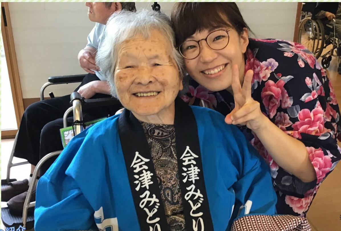
※令和元年以前に撮影された写真です。