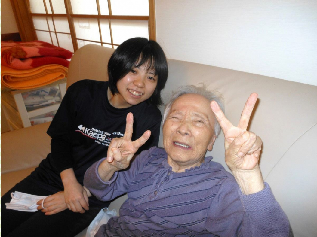
※令和元年以前に撮影された写真です。