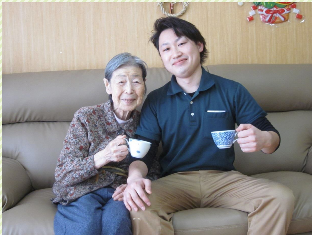
※令和元年以前に撮影された写真です。