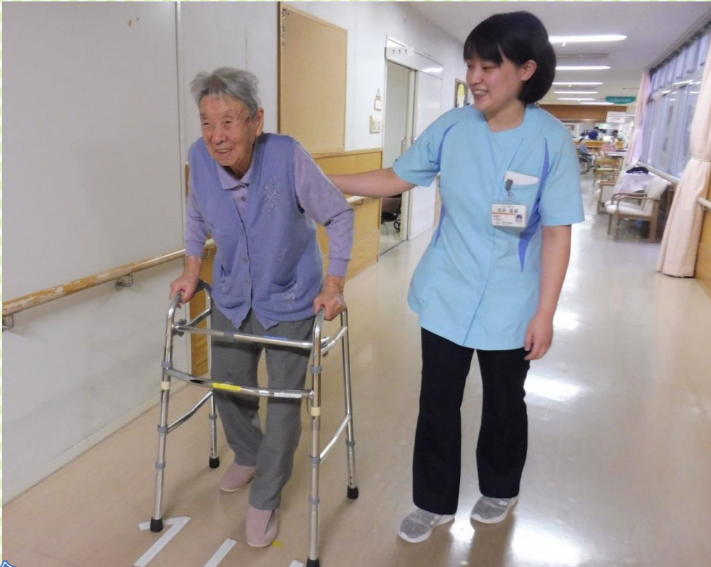
※令和元年以前に撮影された写真です。