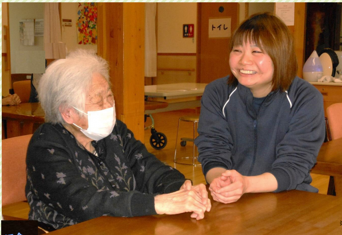
※令和元年以前に撮影された写真です。