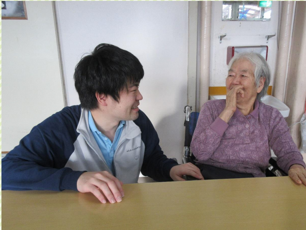
※令和元年以前に撮影された写真です。