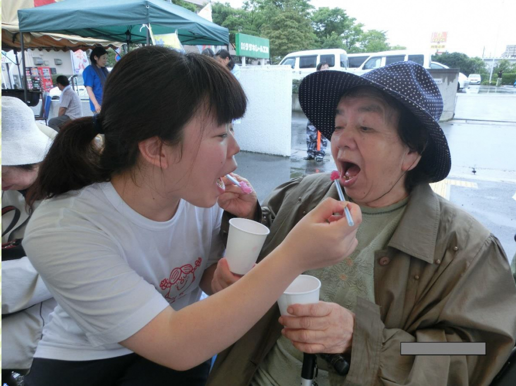
※令和元年以前に撮影された写真です。