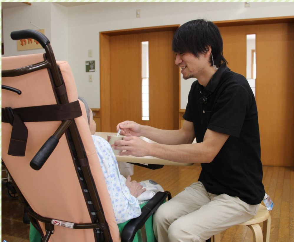
※令和元年以前に撮影された写真です。