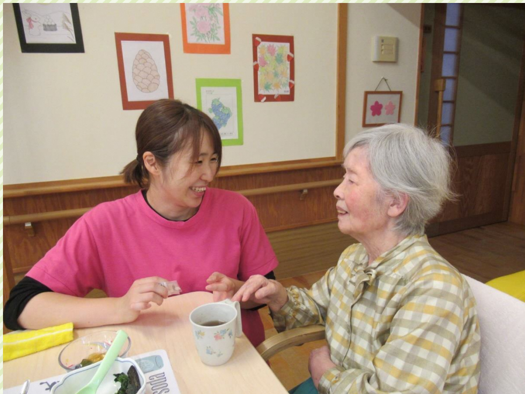
※令和元年以前に撮影された写真です。