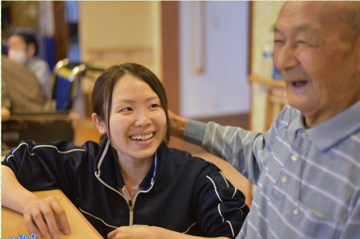
※令和元年以前に撮影された写真です。