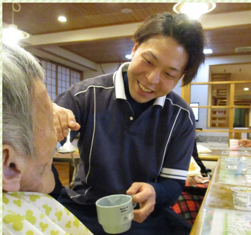
※令和元年以前に撮影された写真です。