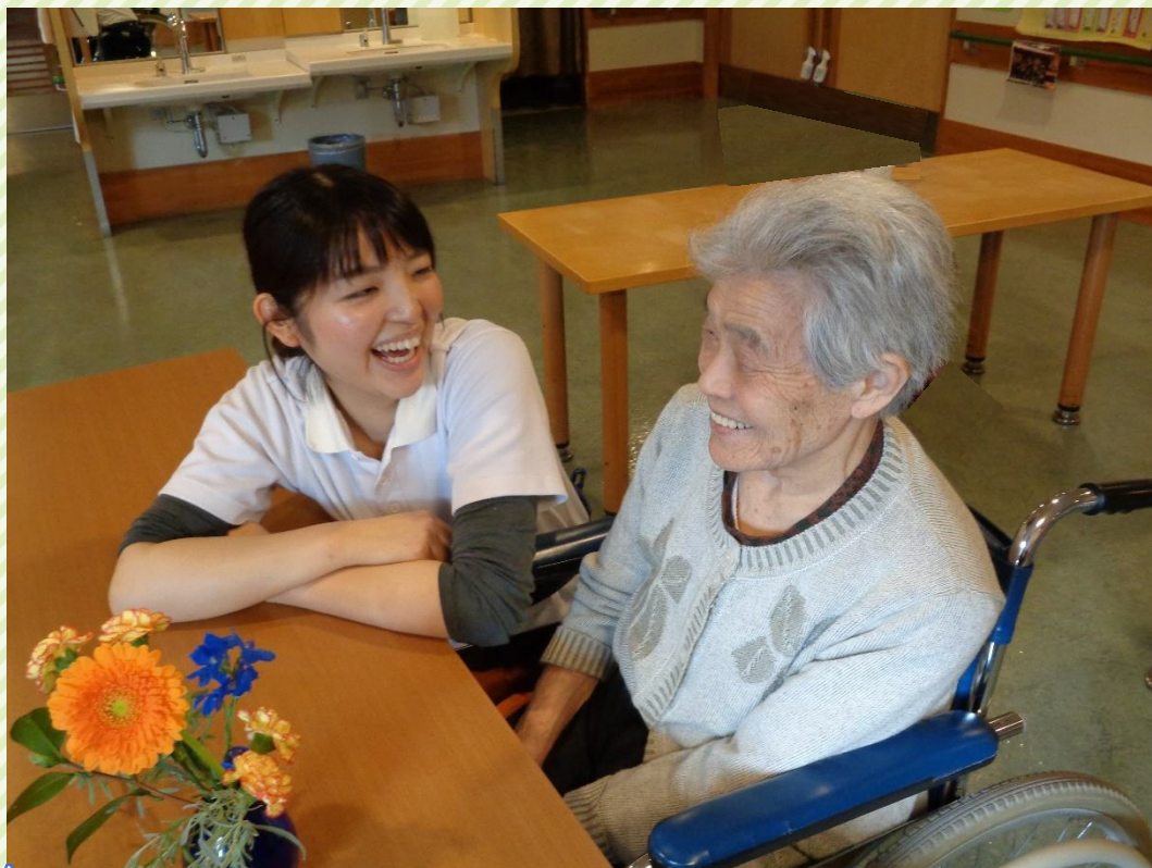
※令和元年以前に撮影された写真です。