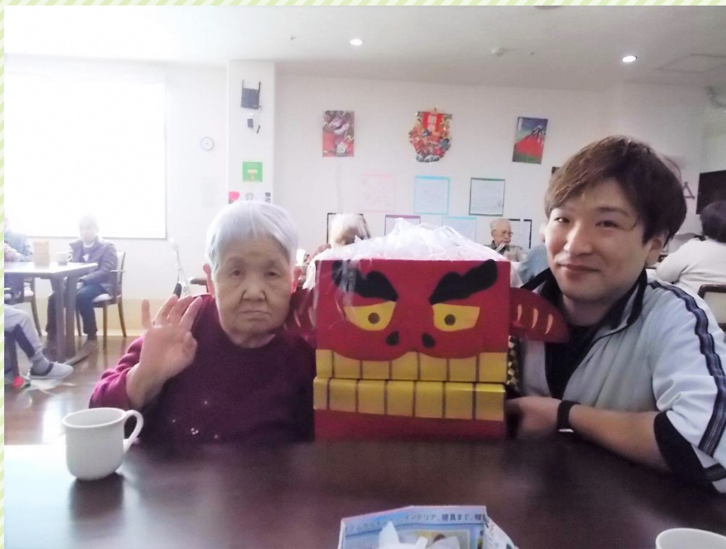
※令和元年以前に撮影された写真です。