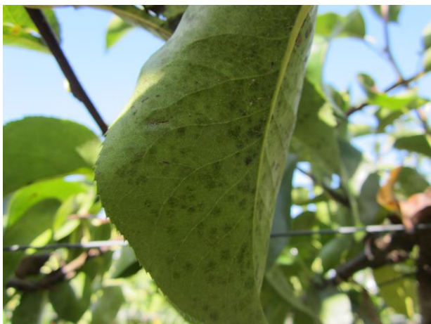
図2 罹病葉（秋型病斑）