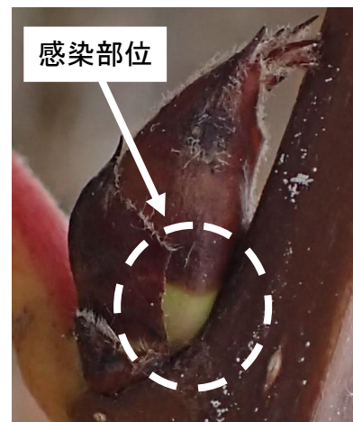
図3 露出したりん片生組織