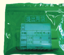
【大腸がん検体容器】

検体容器をお持ちでない方は、右記窓口にて配布しますので、 検体採取前にお受け取りください。