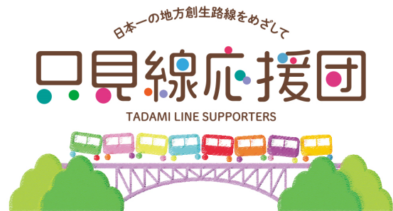
只見線応援団ロゴマーク