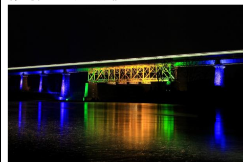
（参考）一ノ戸川鉄橋のライトアップ

喜多方市では実行委員会を組織し、福島遺産百選に選定された JR 磐越西線の一ノ戸川鉄橋のライトアップを行っている。