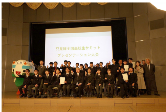
（参考）第 1 回只見線全国高校生サミット

生活の利便性や暮らしやすさの向上につながる、新たな只見線の活用方法のアイデアを募集し、優良なアイデアを実験的に試行するコンテストの開催について検討します。