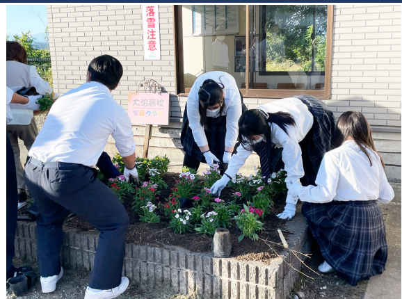
会津高田駅前での花壇整備