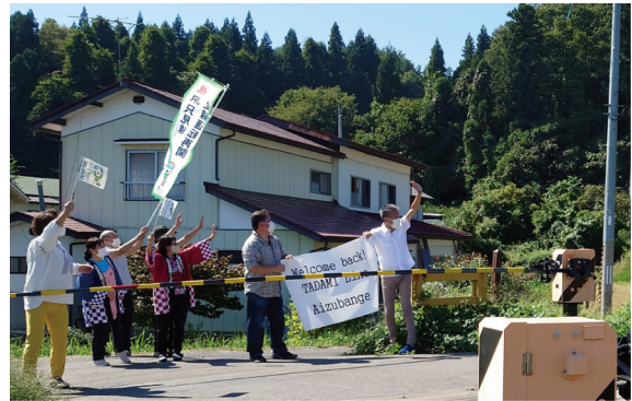
会津坂下町杉踏切での歓迎