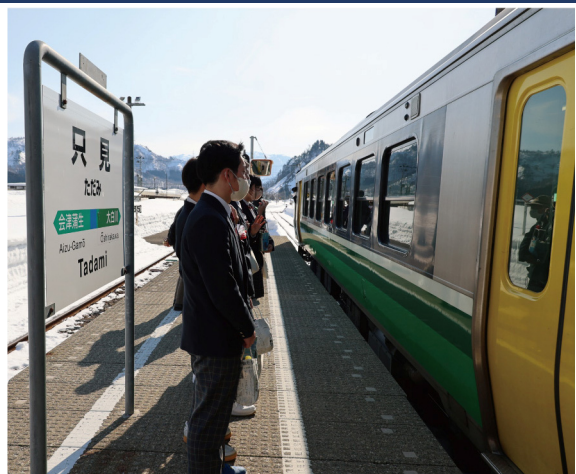
只見線を利用する高校生