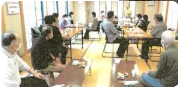
(歴史教室(地元の歴史を知ろう!)の様子)