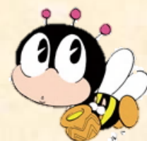
「マナビィ」 生涯学習のマスコット