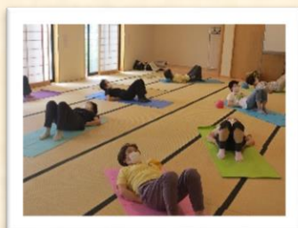
〔にこにこ体カアップ講座〕