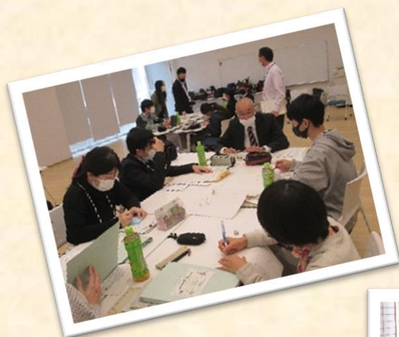
〔ジャーナリストスクール開催事業〕